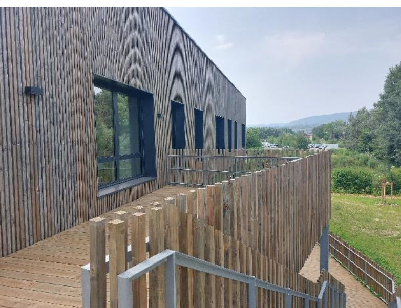
Fig.: En haut: rampe sur l'entrée. Ci-dessus: terrasse supérieure. A gauche: box de réunion