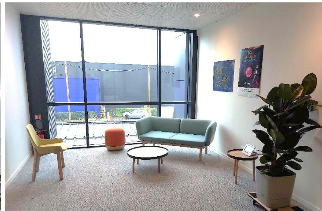
Fig.: En haut: à gauche: salle de réunion; à droite: open-space paysager. En bas à gauche: escalier principal; à droite: salle détente.